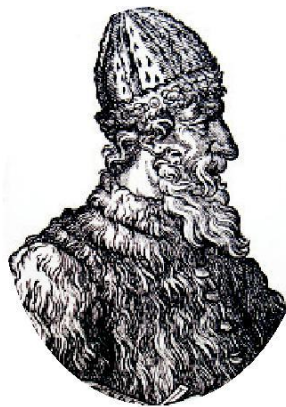
Великий князь Иван III

До XVIII века чиновники на Руси жили благодаря так называемым «кормлениям», то есть, при отсутствии оклада за исправление должности, разрешению на подношения от заинтересованных в их деятельности лиц. Одаривали их не только деньгами, но и «натурой» — мясом, рыбой, пирогами и пр., что было делом обыкновенным.