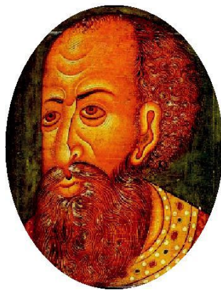
Царь Иван IV Грозный